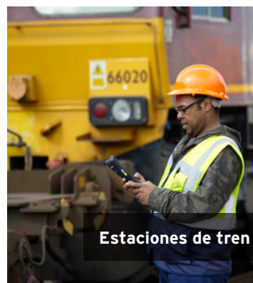
Estaciones de tren

La cámara a color de 3 mega píxeles ofrece enfoque automático, zoom de 4X, flash de LED dual y capacidad de video.