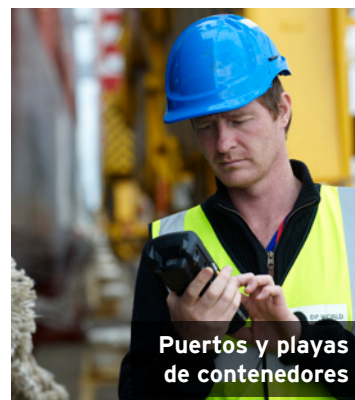
Puertos y playas de contenedores